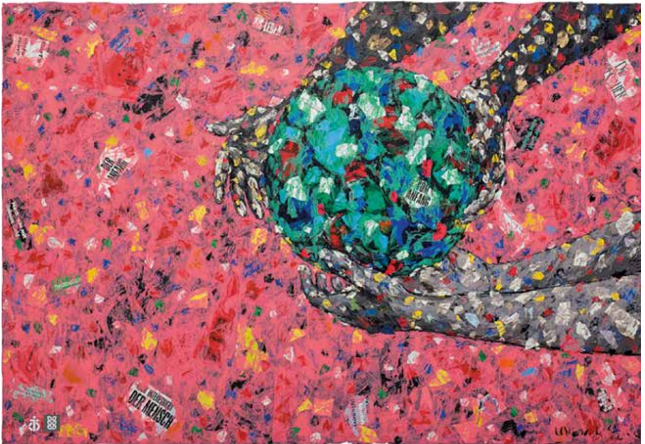
Das MISEREOR-Hungertuch 2023 «Was ist uns heilig?» von Emeka Udemba © MISEREOR.

Giffers-Tentlingen Plaffeien Plasselb Rechthalten-Brünisried St. Silvester