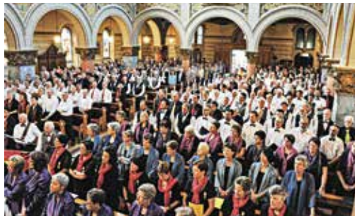
Verbandsfest des Cäcilienverbands Deutschfreiburg in Plaffeien 2012

Am Freitag, Tag der Generationen, werden gegen 500 Kinder aus dem ganzen Kanton auftreten. In drei Atelier-Konzerten und im Finale zum 1. Mai-Wettbewerb werden die Jüngsten zu hören und zu sehen sein. Zudem präsentiert der Jugendchor St. Michael das Konzertprogramm «Die Jugend als Friedensbotschafterin». Die Fachstelle Kirchenmusik lädt im Mitmach-Atelier (Gross-)Eltern und Kinder zum gemeinsamen Singen ein.